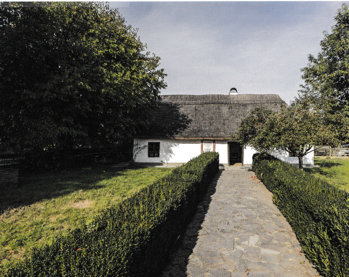
Casa memorială Ady Endre / Az Ady Endre Emlékház / Ady Endre Gedenkhaus / Ady Endre Memorial House

A nagykarolyi Károlyi kastély, az Érkávás községbeli Ady Endre Múzeumegyüttes, az Apa községbeli Dr. Vasile Lucaciu Emlékház, a szatmárnémeti Művészeti Múzeumban található Aurel Popp Állandó Kiállítás, az aranyosmeggyesi dák kemencék a Megyei Múzeum gyűjteményeivel együtt fontos célpontjai a Szatmár megyei kulturális turizmusnak. Több tízezres évi látogatottságukkal ezek képezik azon programok alapjait, amelyek évről évre bővülnek. Azonban egy olyan megye mint Szatmár tuisztikai lehetőségei ennél jóval nagyobbak, melyeket ki kellene használni - már csak stratégiai elhelyezkedése okán is -, hiszen itt van az ország kapuja Magyarország és Ukrajna felől, átmeneti terület a történelmi Máramaros felé, de Erdély közepe felé is a Meszes hegységen keresztül.