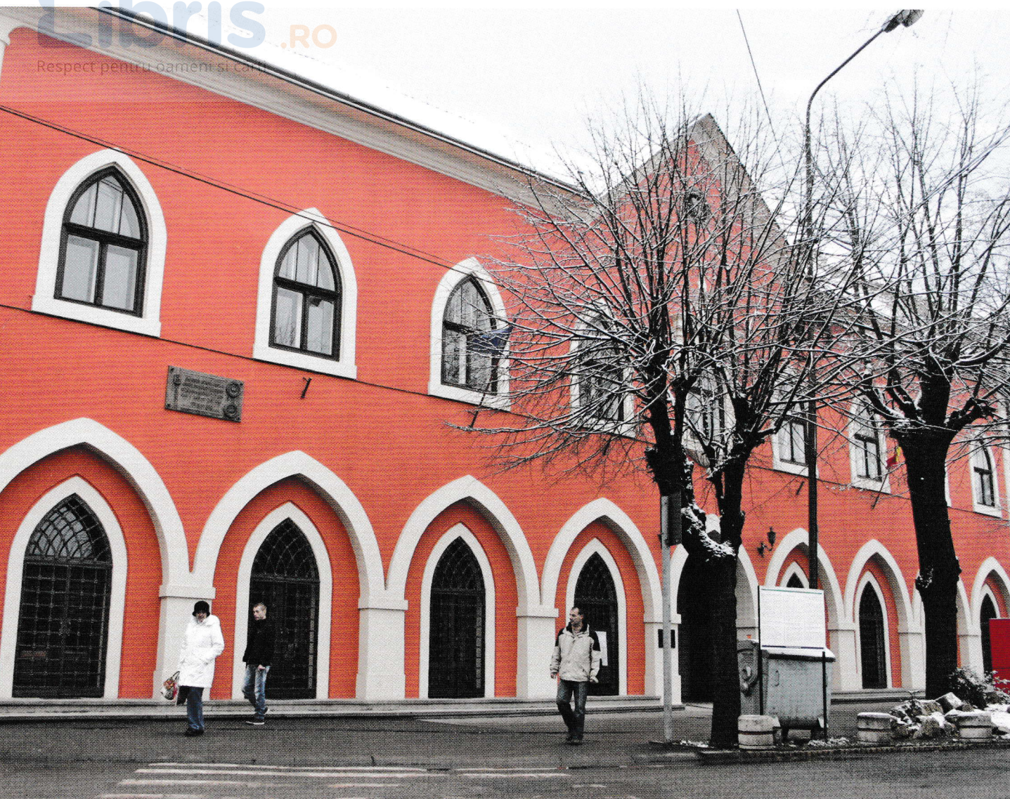
Muzeul de Artă Satu Mare / A szatmárnémeti Művészeti Múzeum / Kunstmuseum aus Sathmar / The Satu Mare Art Museum

Karolyi Castle in Carei, Ady Endre Museum Complex in Căuaș, Vasile Lucaciu Memorial House in Apa, Aurel Popp Permanent Exhibition at The Satu Mare Art Museum, The Dacian Ovens in Medieșu Aurit alongside the collections at The County Museum are centerpieces of the Satu Mare County's cultural tourism. With tens of thousands of visitors each year, all these represent the backbone of a project which demands to be updated year after year. The tourist potential of a county such as Satu Mare, located in a strategic position – the entrance gate towards Hungary, but also Ukraine, a transition area to the historic Maramureș, but also to the heart of Transylvania, crossing the Meseș Mountains – it is much bigger and demands to be valued more and better turned to advantage.