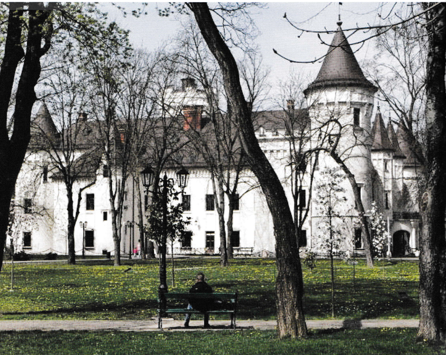
Castelul Károlyi din Carei/ A nagykárolyi Károlyi kastély / Schloss Károlyi aus Großkarol / The Károlyi Castle in Carei

Castelul Károlyi din Carei, Complexul Muzeal Ady Endre din comuna Căuaș, Casa Memorială dr. Vasile Lucaciu din comuna Apa, Expoziția permanentă Aurel Popp de la Muzeul de Artă Satu Mare, Cuptoarele Dacice de la Medieșu Aurit, alături de colecțiile Muzeului Județean sunt piesele de rezistență ale turismului cultural din județul Satu Mare. Având anual zeci și zeci de mii de vizitatori, ele constituie coloana vertebrală a unui proiect ce se cere completat an de an. Potențialul turistic al unui județ ca Satu Mare, așezat într-o poziție strategică -- poartă de intrare spre Ungaria, dar și spre Ucraina, punct de tranziție spre Maramureșul Istoric, dar și spre inima Transilvaniei, traversând munții Meseșului -- este însă mult mai mare și se cere valorificat.